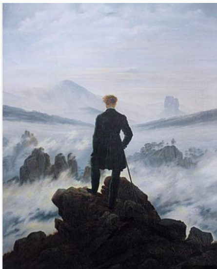
Casper David Friedrich, Vandrerens over tågehavet , 1818