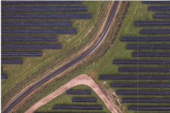
Information, 2023: Foto: Michael Drost-Hansen