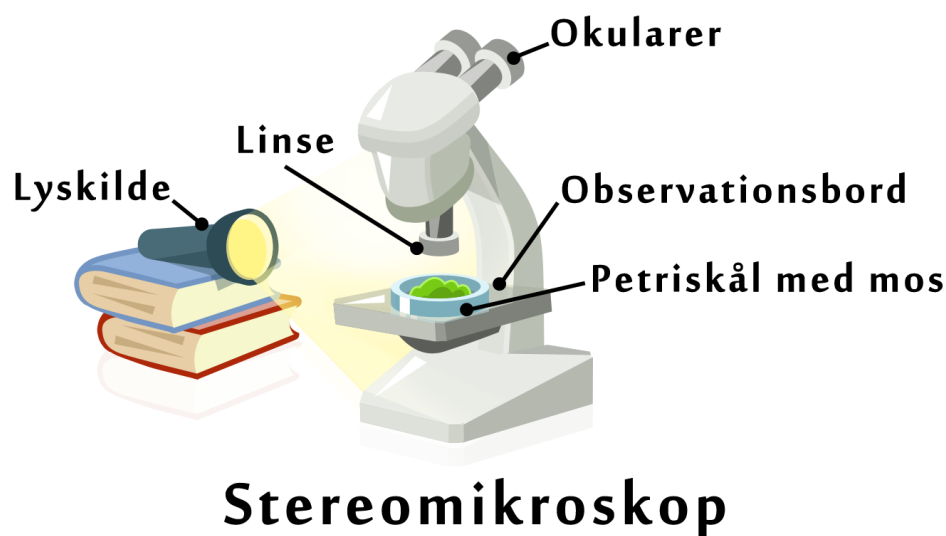
Figur 1. Her ses opstillingen til forsøget. Petriskålen placeres på stereomikroskopets observationsbord og der lyses ind på den fra siden.